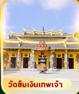
วัดยิมเจินเทพเจ้า