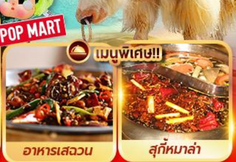
อาหารเสฉวน