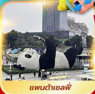
แพนต้าเซลฟี