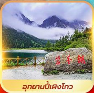
อุทยานบีเผิงโกว