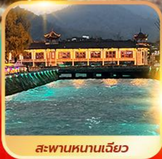
สะพานหนานเจียว